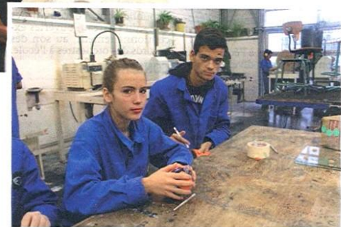
Et à trois pour le tailler et le décorer. Pour chaque domaines on retrouve des formations pré-bac ou des adaptations parcours de formation.

Il est donné conjointement par trois ministères. Celui de l'Éducation, de la recherche et de l'enseignement supérieur, celui du Travail et celui de l'Industrie. Le campus est avant tout un réseau de plusieurs établissements, qui comprend le SIGMA de Clermont, spécialisé dans la formation des ingénieurs, le lycée professionnel Desaix à Saint-Eloy-les-Mines, le lycée Joseph Constant à Murat (Cantal), Le lycée Descartes à Cournon d'Auvergne, le lycée Albert Londres à Cusset, l'IFP-Bains et l'université Clermont Auvergne.