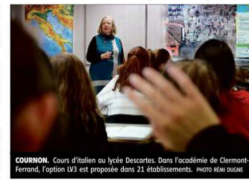
COURNON. Cours d'italien au lycée Descartes. Dans l'académie de Clermont-Ferrand, l'option LV3 est proposée dans 21 établissements.

« Avec la réforme, non seulement la LV3, désormais appelée LVC, ne serait maintenue que comme option facultative, mais le poids des points obtenus au baccalauréat serait fortement diminué », pointe Laurence As-